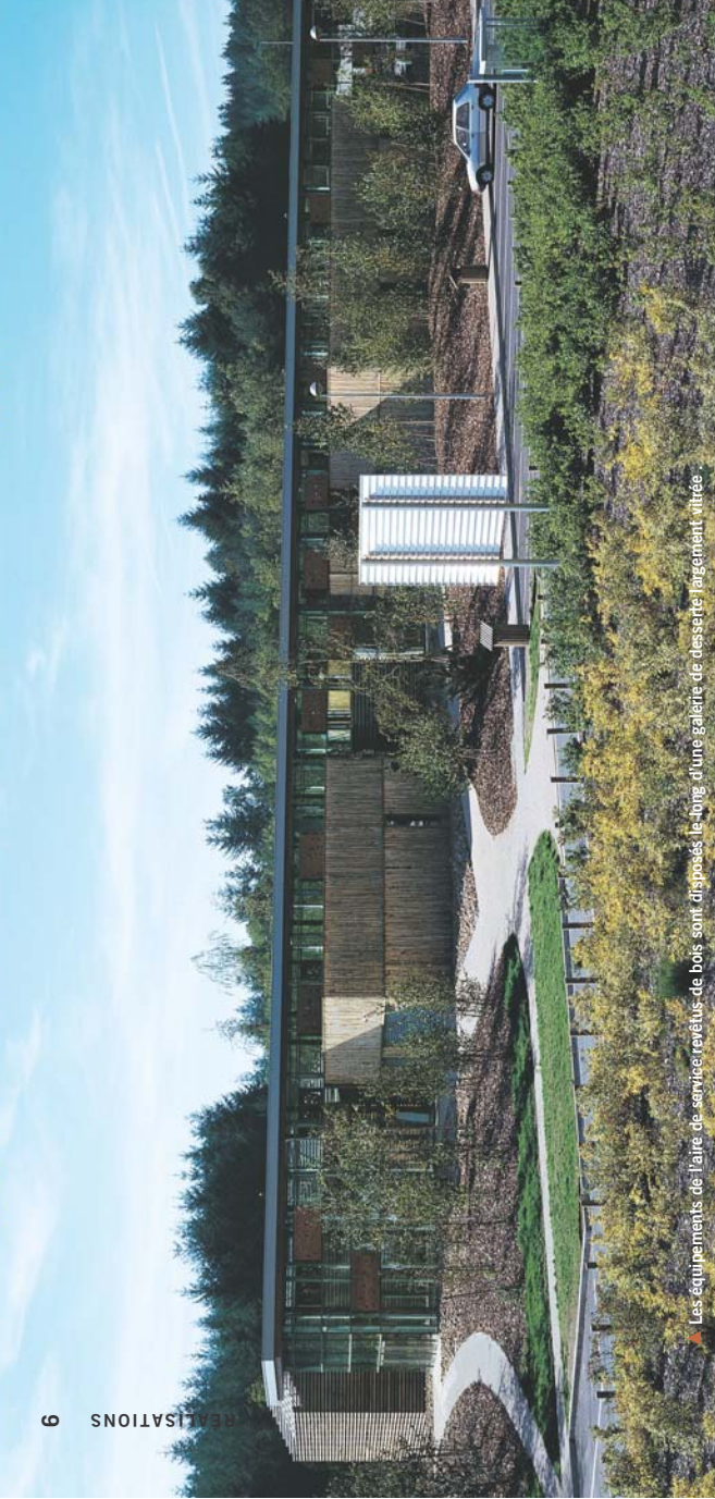
▲ Les équipements de l'aire de service revêtus de bois sont disposés le long d'une galerie de desserte largement vitrée.